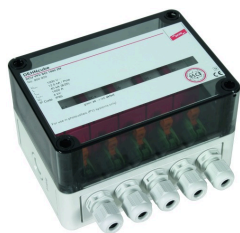
Az ábrák nem kötelező érvényűek